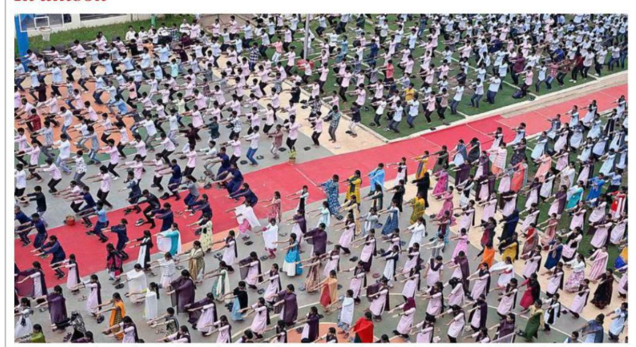
Students performing yoga in a marathon session organised to mark the 10th International Day of Yoga, at KBN College in Vijayawada on Friday. G.N. RAO