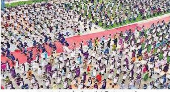
విజయవాడ పాతబస్త్రీలోని కెబీఎన్ కళాశాలలో..

దేహానికి ఆసనం.. ఆరోగ్యానికి సింహాసనం అని.. పిల్లలు, యువత, మహిళలు, వృద్ధులు విభిన్న యోగాసనాలతో చాటిచెప్పారు. అంతర్వా తీయ యోగా దినోత్సవం పురస్కరించుకొని శుక్రవారం ఉమ్మడి కృష్ణా జిల్లాలో ప్రజాప్రతినిధులు, ఆధికారులు, వివిధ సంహాల ఆధ్వర్యంలో యోగా వేడుకలు నిర్వహించారు. యోగా.. ఆరోగ్యానికి దివ్య ఔషధం.. శారీరక వికాసానికి... మానసిక ఒత్తిడిని చిత్తు చేసే తారక మంత్రమని నిపుణులు వివరించారు. — ఈనాడు. అమరావతి